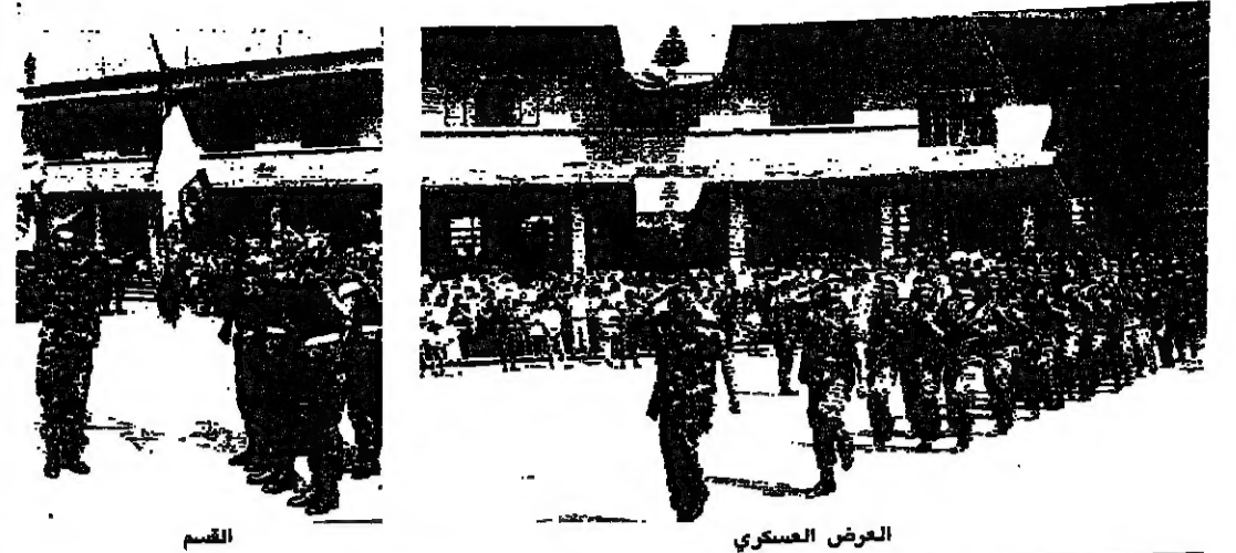
العرض العسكري - من ميشال كرم